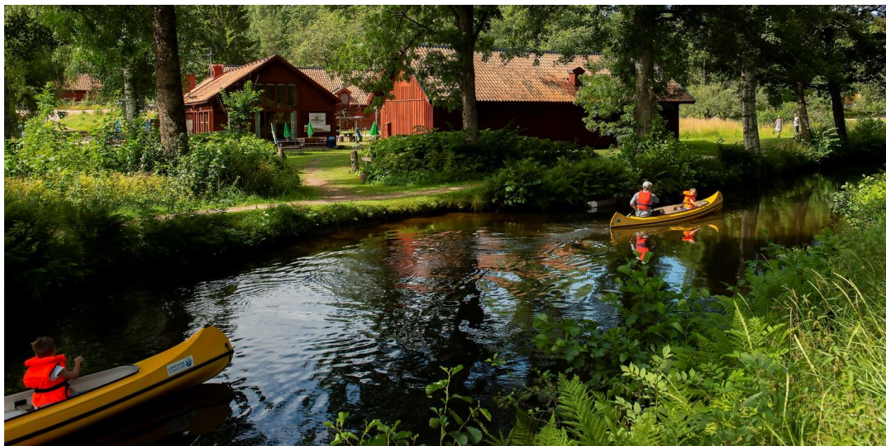
Vy från kanalkafé Skantzén.