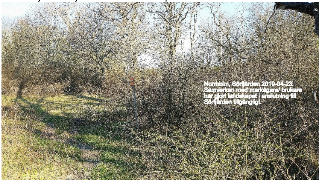
Norrholm i Jäders socken

För att grönstrukturplanen skall få den stora funktion i arbetet med biologisk mångfald, som verkar vara tanken, behövs också samråd och implementering med berörda parter i samband med åtgärder. Här kan samarbetet mellan markägare och naturvård vid Sörfjärden tjäna som ett exempel.