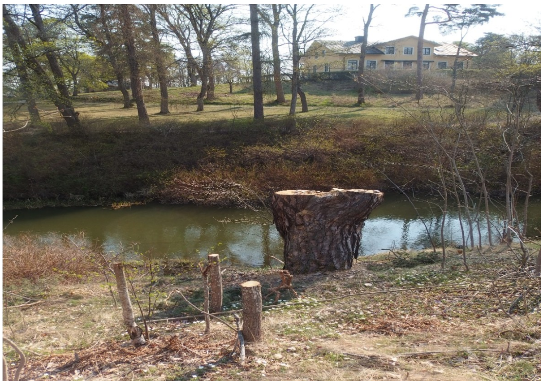
Misslyckad avverkning vid Nybyparken i Torshälla

Vi vill gärna få del av en plan för hur kommunen tänker spara gamla värdefulla träd i de olika tätorterna. Idag sågar man ner många ekologiskt värdefulla träd för att de blivit fula, som skett i Torshälla på flera håll. I andra kommuner toppar man träd för att förlänga deras liv. Med en ökad förtätning av bebyggelsen är det värdefullt att bevara grönska med tillhörande upplevelser. Man skapar inte hundraåriga träd över en natt. Att träd betyder mycket för människor illustreras av den debatt som blivit i samband med att Västerås stad håller på att bygga om en gata och skall ersätta gamla träd med unga träd. Gamla träd, tex. i Torshälla, är viktiga platser för bl. a. fladdermöss, men även för den rödlistade mindre hackspetten. De är dessutom mycket viktiga för den biologiska mångfalden.