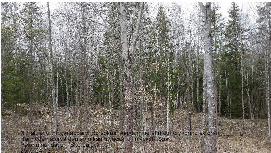
N Hattranv. Flugsnapparv. Borsökna. Aspdominerat med förnyring av gran. Här höga naturvärden som kan utvecklas till mycket höga. Rekommendation: Skörda gran. 2019-04-16

Det finns i dag i landskapet många värdefulla restbiotoper, som har skapats genom att områdena "glömts bort". Det gäller tex Gråbergsparken i Stenby. Genom mångskogsbruk kan värdefulla miljöer skapas tex vid Gråsparvsvägen/ Koltrastvägen i Borsökna och Hattranvägen och Flugsnapparvägen också det i Borsökna. Där är det möjligt att till exempel genom "granskörd" skapa natur- och rekreationsvärden.