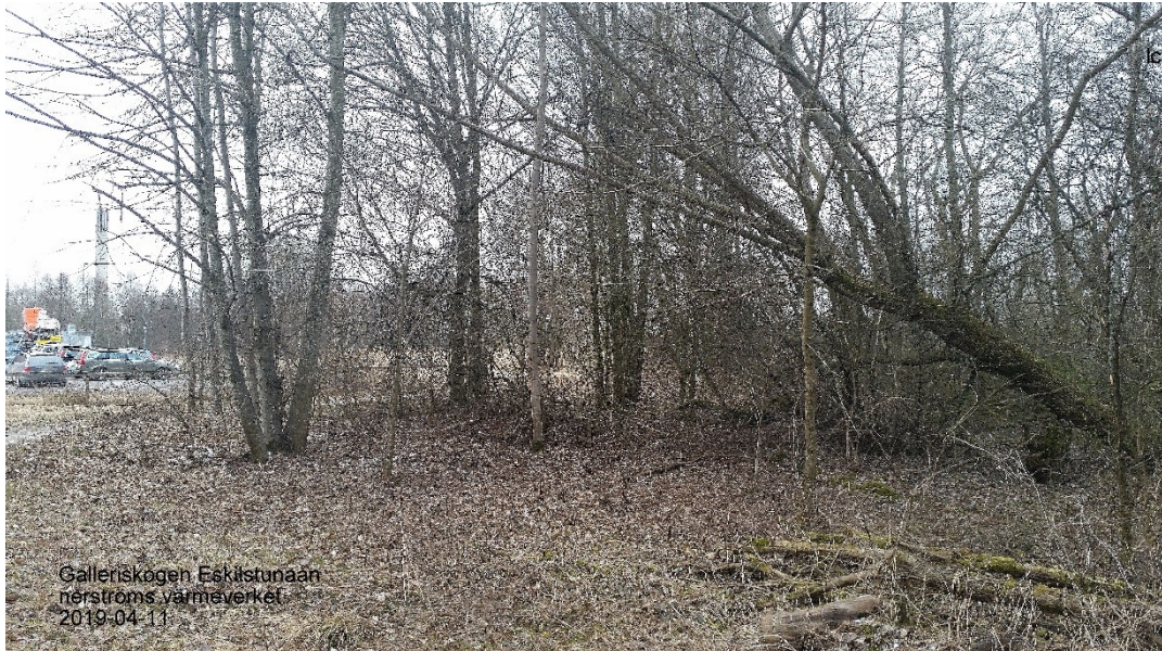
Biologisk mångfald vid Å-stråket

En annan värdefull restbiotop är "buskmarken" längs ån från Värmeverket nedströms till Ekeby Våtmark, vars ekologiska funktion behöver förbättras.