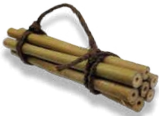
Bamburör – fäst dem så att de inte rör sig.