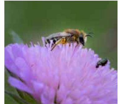
Sidenbi på åkervädd.