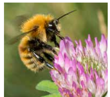
Backhumla på rödklöver.