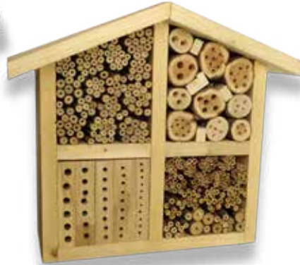
Vildbi-lyxhotell av träbitar och ihåliga växter, fläder, hallon, vass.