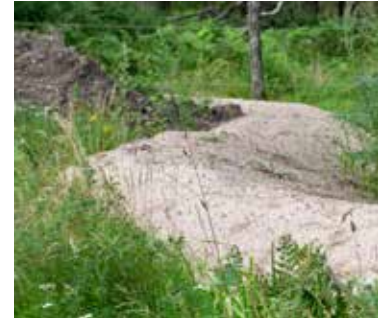
Sandbädd i trädgård.

Rapportera din sandbädd på www.raddabina.nu