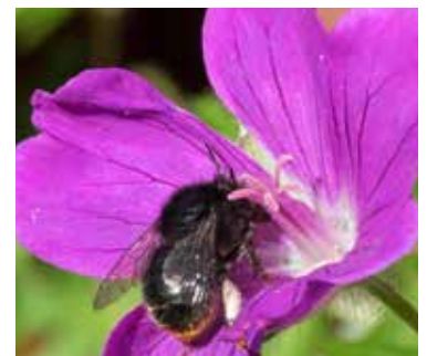
Dånpälsbi på blodnäva.