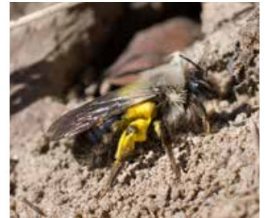
Sälgandsbi vid bohål.