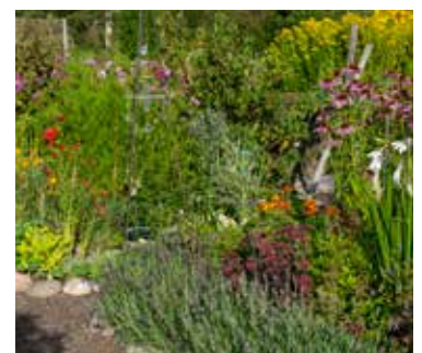
Kolonilott med bivänliga växter.