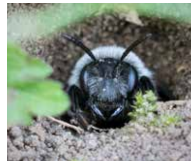
Tittut! Sobersandbi i bohål.