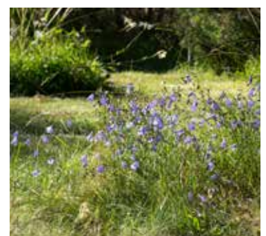
Skapa blommande öar genom att klippa gräsmattan selektivt.