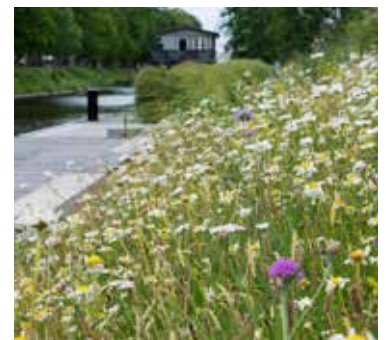
Äng i stadsmiljö.