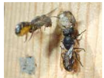
Väggbin vid bohål.