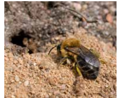
Värsidenbi gräver bohål.