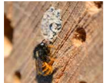
Rödmurarbi vid sitt bo.

Rapportera ditt vildbihotell på www.raeddabina.nu