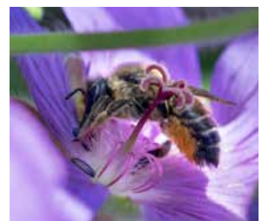
Stocktapetserarbi på näva.