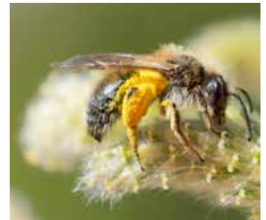
Vårsandbi på pil.

Rapportera din räddningsinsats på www.raddabina.nu