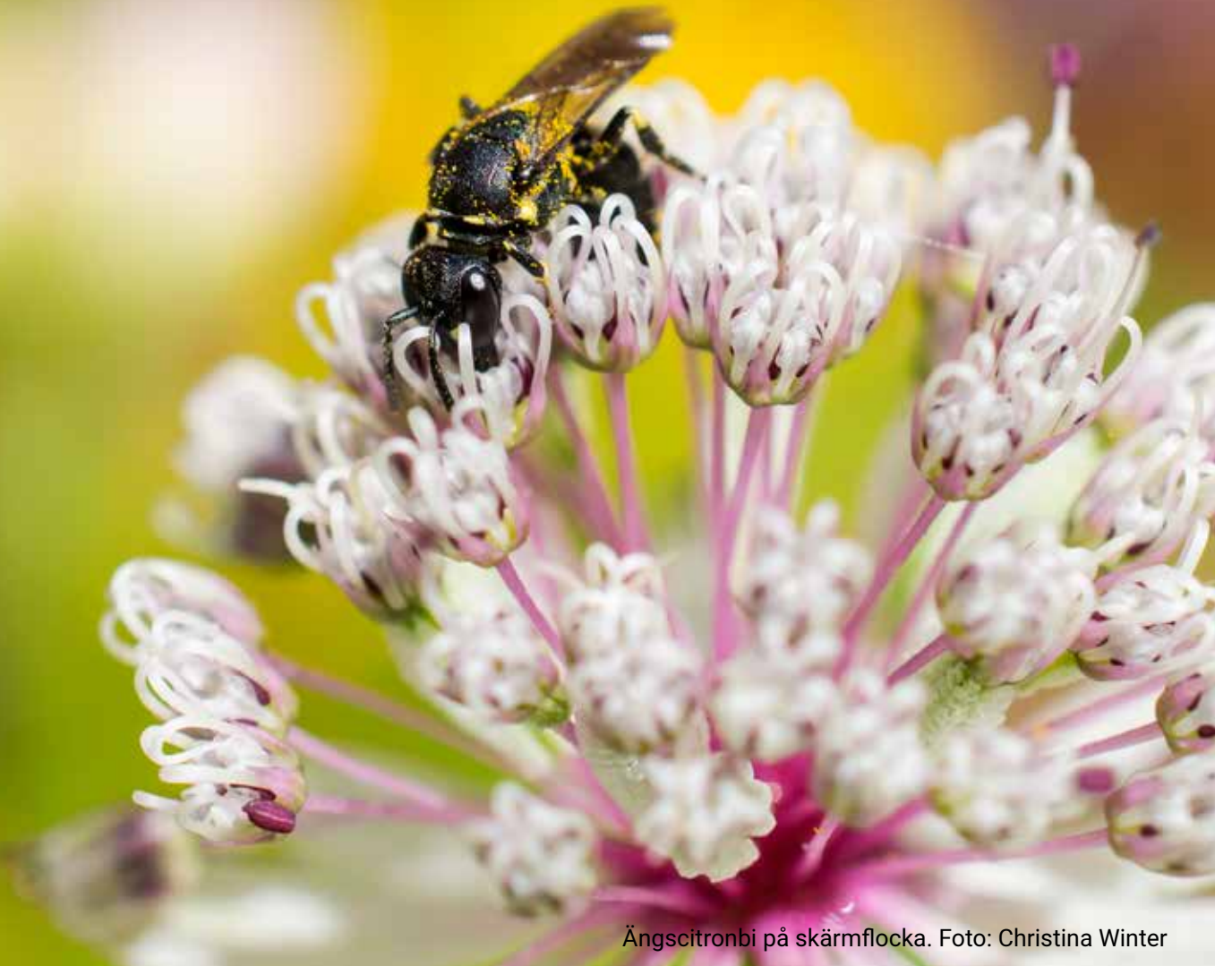
Ängscitronbi på skärmflocka.