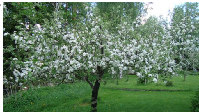
Äppelträd i äldre trädgård. Även nässlorna i bakgrunden och maskrosorna i gräsmattan lockar till sig insekter och är viktiga för den biologiska mångfalden.