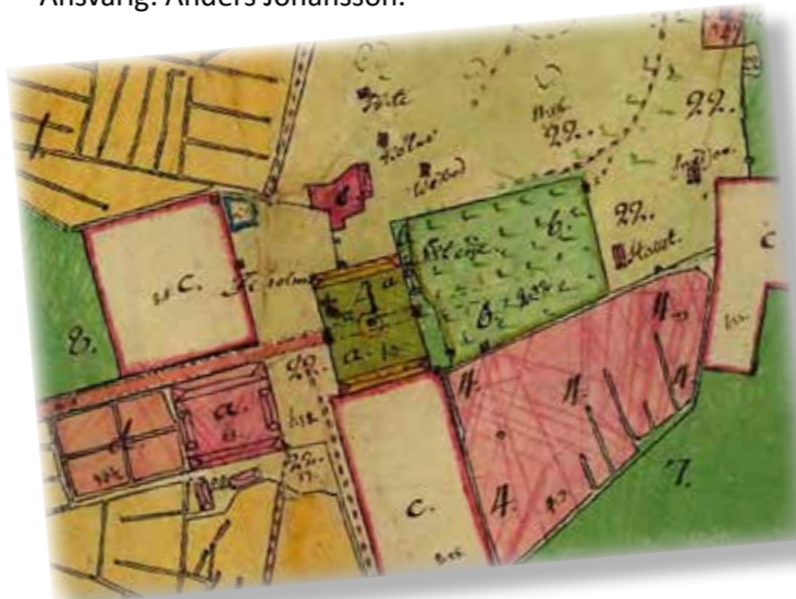
Karta över Axel Oxenstiernas gods Fiholm i Jäder.