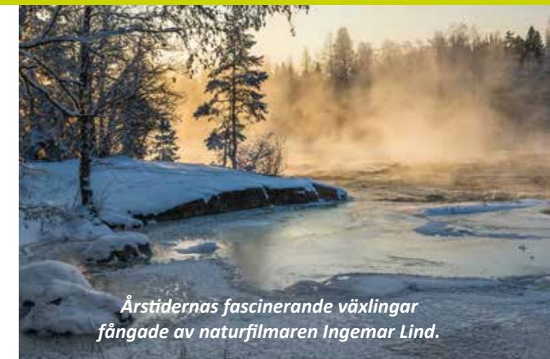
Årstidernas fascinerande växlingar fångade av naturfilmaren Ingemar Lind.

Kontakta styrelsen om du har intressant material som du vill dela med oss andra.